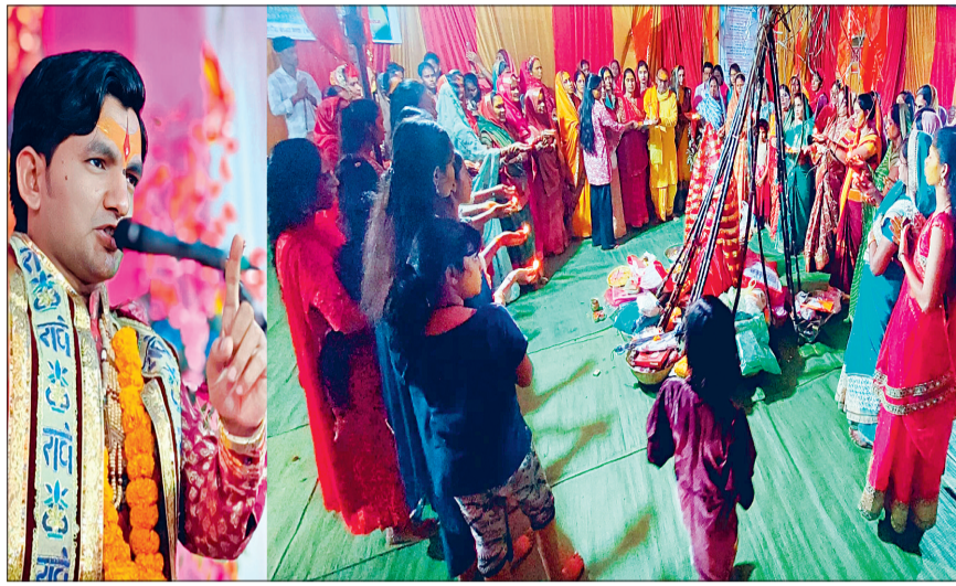
हरिभूमि न्यूज ►► पलारी